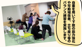
自宅専用器具の活用強化 パラソルを用いた筋力強化 の運動を実施しています。