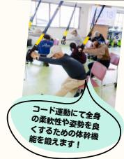
コード運動にて全身の柔軟性や姿勢を良くするための体幹機能を鍛えます！