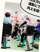
持久力を高める有酸素運動にて心肺機能の向上を図っています。